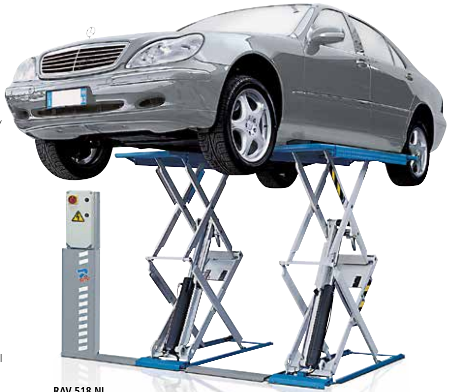
RAV 518 NL

La altura mínima del suelo facilita el acceso y permite encontrar la mejor posición para el levantamiento del vehículo. El limitado espacio que ocupa, tanto de largo cuanto de ancho, deja libre la zona cerca del elevador, aumentando la seguridad en la zona de trabajo. Ideal para reparaciones mecánicas, servicio neumáticos y amortiguadores, es una óptima elección en zona de recepción del vehículo.