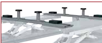
S 505 A2 (2 x kit)