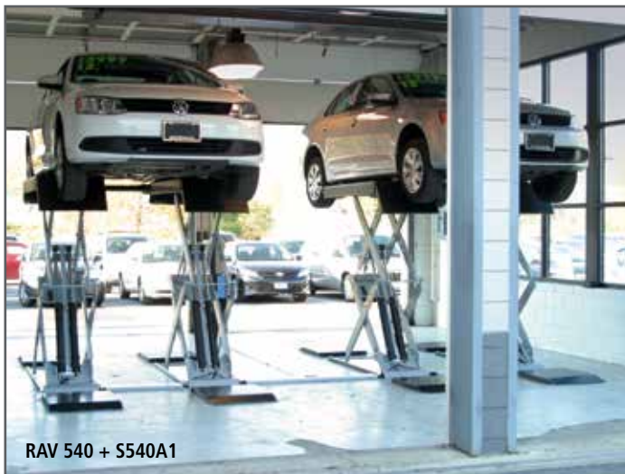
RAV 540 + S540A1

Versione ad alta portata con lunghezza pedane maggiorata. High capacity model with longer lifting plates. Version mit größerer Tragfähigkeit und längerer Aufnahmeplatte. Version haute capacité avec plateformes rallongées. Versión de alta capacidad con plataformas más largas.